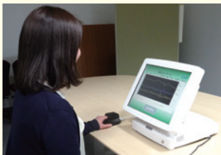
らくらくウエルネス（血管年齢測定機）