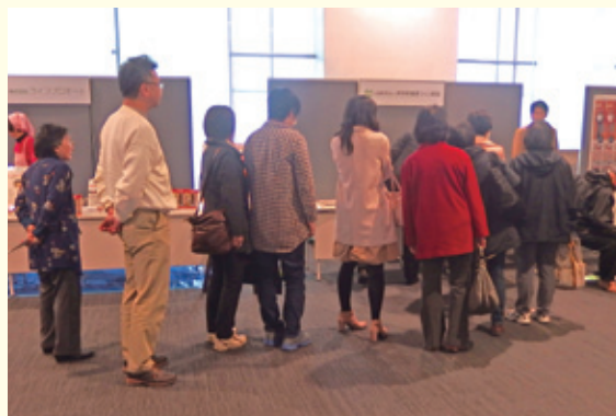
「元気にいがた健康フォーラム」出展風景

健康教育資材の詳細につきましては、本財団ホームページの「啓発普及機材貸出」を参照ください。 http://www.nhf.or.jp/hp/keihatu.html